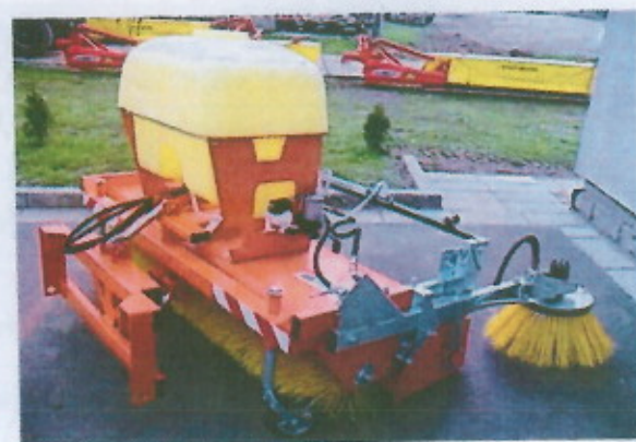
Zametací adapter ZAR