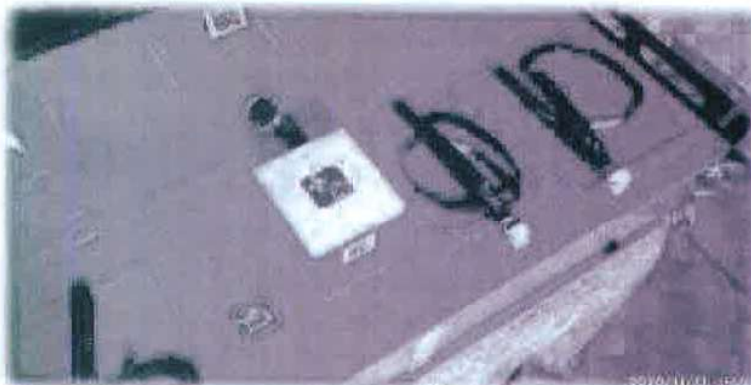
Obrázek 3 - ilustrativní zobrazení možného provedení