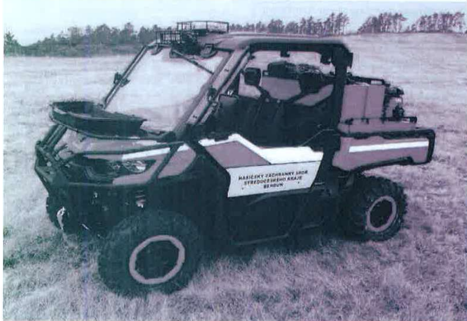
Obrázek 1 - příklad skutečného provedení vozidla (majitel: HZS Středočeského kraje)

10.5. Na přední a zadní části vozidla je umístěn nápis „HASIČI“, výška písma je nejméně 100 mm. splňuje