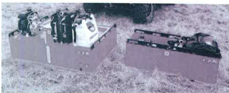
Obrázek 4 - příklad skutečného provedení (majitel: HZS Středočeského kraje)

*Technické podmínky vydané MV-GŘ HZS ČR jsou veřejně dostupné ke stažení na webových stránkách: www.hzscr.cz/clanek/katalog-vydanych-technickych-podminek-pozarni-techniky-a-vecnych-prostredku.aspx